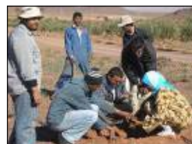
Formations théoriques et démonstrations pratiques

Le projet propose la prise en charge des financements nécessaires à l'installation des jeunes (création de leur TPE).