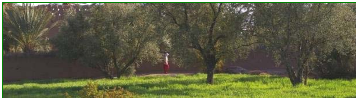
Douar d'installation dans la palmeraie de Skoura