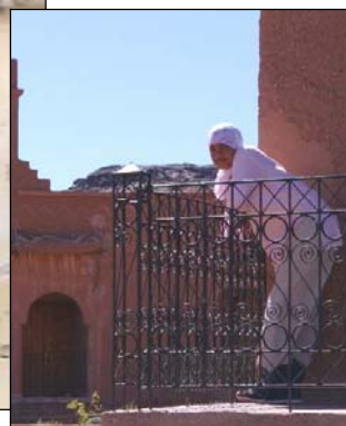
Future exploitante en élevage Zone d'Agdz